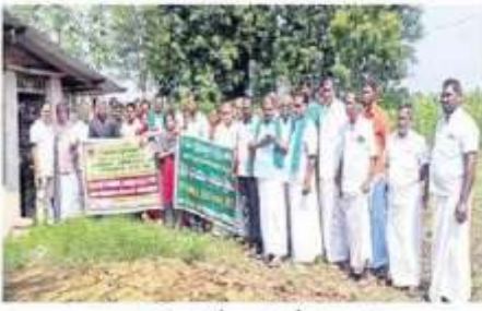
ప్రకృతి వ్యవసాయ క్షేత్రాన్ని పరిశీలిస్తున్న రైతులు