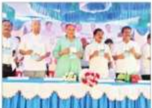
పుస్తకాన్ని అందిస్తున్న ఉప ముఖ్యమంత్రి నారాయణస్వామి