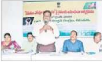
వరదలో ప్రసంగిస్తున్న ఎన్టీఎస్ నాయుడు

రేడిగుంట, అక్టోబరు 25 : వైతంల సమతుల ఎరువుల వాడకం తప్పనిసరిగా పాటించాలని ఎన్టీ వ్యవసాయ కళాశాల ప్రధాన శాస్త్రవేత్త వార్త మే మేన్ నాయుడు తెలిపారు. రేడిగుంట మండలం అంజనేయ వైతంల వారి కృషి విజ్ఞాన కేంద్రంలో మం గిజావారు సమతుల ఎరువుల వినియోగంపై శిక్షణ ఇచ్చి అవగాహన చేపట్టి వివరించారు. కార్యక్రమంలో అధిక వినియోగం చేసే యంత్రం, అధిక వినియోగం చేసే యంత్రం వర్తమాను వివరించారు. ఇప్పటి వరకు కేటీలో 25 మందిని పంపించారు. వేరువేరు యంత్రం, టిఫిన్ లాంటి అధిక వినియోగం చేసే యంత్రం వర్తమాను వివరించారు. ఇప్పటి వరకు కేటీలో 25 మందిని పంపించారు.