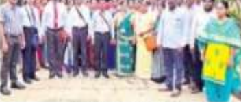
శ్రీలంక శ్రీలంక అధికారులు

రేడియో, అక్షరాలు 28 రేడియోలను మంచు అంబేద్కరు సేవలలోని రాస్ కేవీకే విజ్ఞాన కేంద్రాన్ని శ్రీలంక అధికారులు, వ్యవసాయ శాఖల విద్యార్థులు గురువారం సందర్శించారు. కేవీకే విద్యార్థులను వివిధ కార్యక్రమాల గురించి తెలుసుకున్నారు. శ్రీలంకలో మంచి విద్య ఉంటుంది. దీనివల్ల, అభివృద్ధి వ్యవసాయ విద్యలను గురించి వారు శాస్త్రవేత్తలను వివరించారు. శ్రీలంక అభివృద్ధి కోసం రాస్ కేవీకేను వివిధ విధాల గురించి శ్రీలంక అధికారులు వివరించారు. అంతకు శ్రీలంక బృందం విజ్ఞాన కేంద్రం గురించి తెలుసుకున్నారు. రాస్ కేవీకేలోని క్షేత్రాల, అభివృద్ధి నియమ, విద్య విధులను