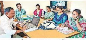
రైతులతో మాట్లాడుతున్న శాస్త్రవేత్తలు

అన్నదాతలకు రాస్ కేపీకే శాస్త్రవేత్తల భరోసా ఈనాడు ఫోన్ కేపీకు రైతుల స్పందన