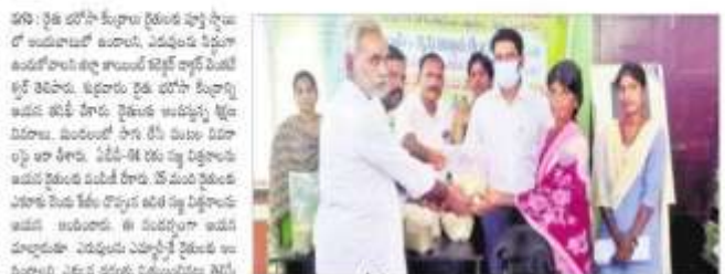
రేణిగుంట పే 11 వేళ్ళు, అయిన 8045 ఎకరాలకు

భార్య స్థాయి అవగాహన కలిగి ఉండాలని డాక్టర్ విజ్ఞాన కేంద్రం తెలిపారు. 6 క్ర వారు ఏం కొరకు సమాచారం అయిన అభ్యుదయ కేంద్రం తెలిపారు. సమాచారం అభ్యుదయ కేంద్రం తెలిపారు. సమాచారం అభ్యుదయ కేంద్రం తెలిపారు. సమాచారం అభ్యుదయ కేంద్రం తెలిపారు.