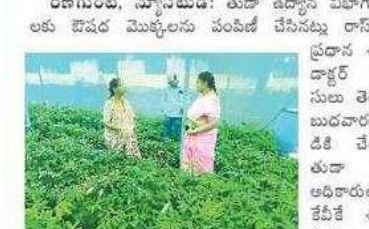
తుడా ఉద్యానవనం హరిత మొక్కలను